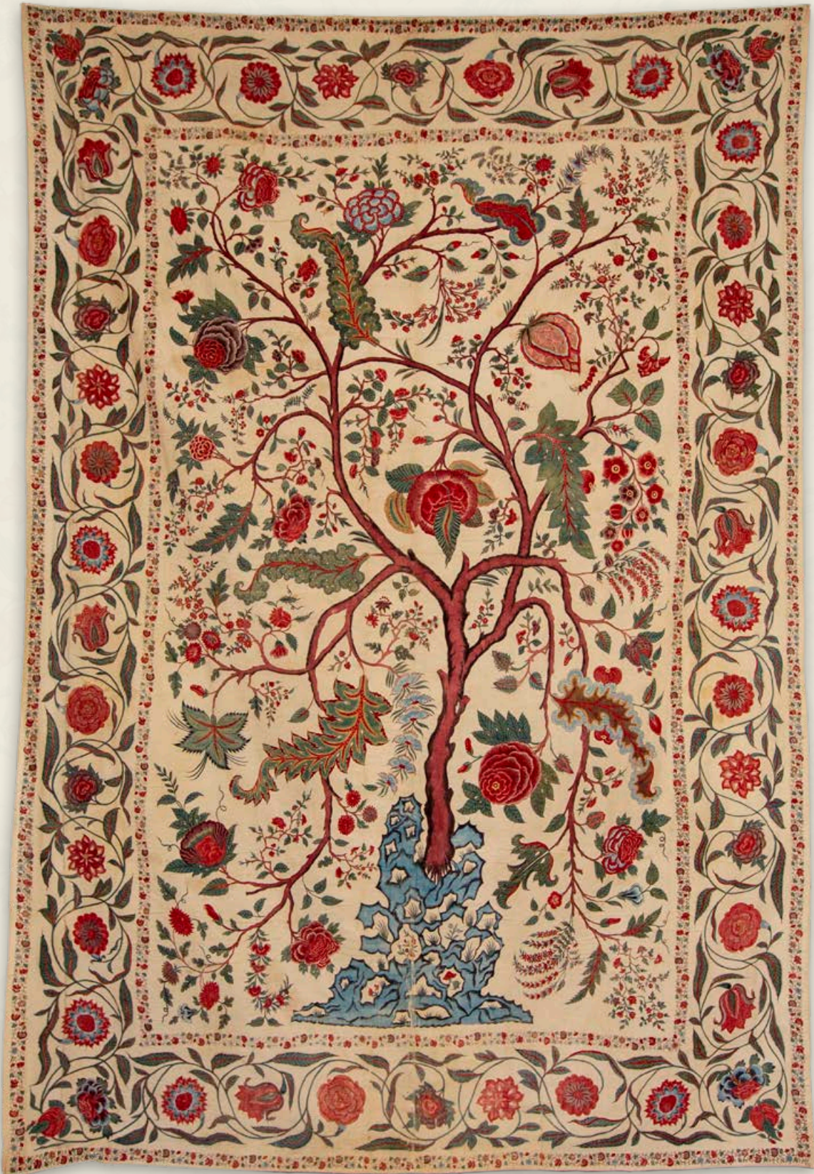
Indische palempore of spreij (1720–1750) · katoen