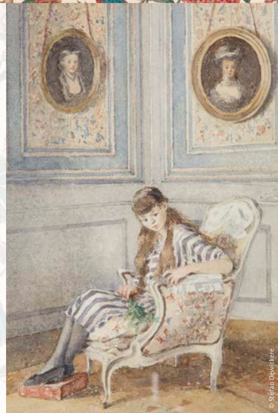
Henriëtte d'Ursel, gravin de Boissieu Portret van Marie (May) d'Ursel (1919) · aquarel

Vervolgens was het de beurt aan textielrestauratrice Jefta Lammens, die net zoals de 18de- en 19de-eeuwse tapiissiers jarenlang heel regelmatig naar het kasteel kwam. In totaal gaat het immers over meer dan 350 vierkante meter stof die centimeter voor centimeter moest worden gerestaureerd. 'Allereerst knipte ik de digitale reconstructies op maat, iets groter dan het bestaande gat. Daarna schoof ik