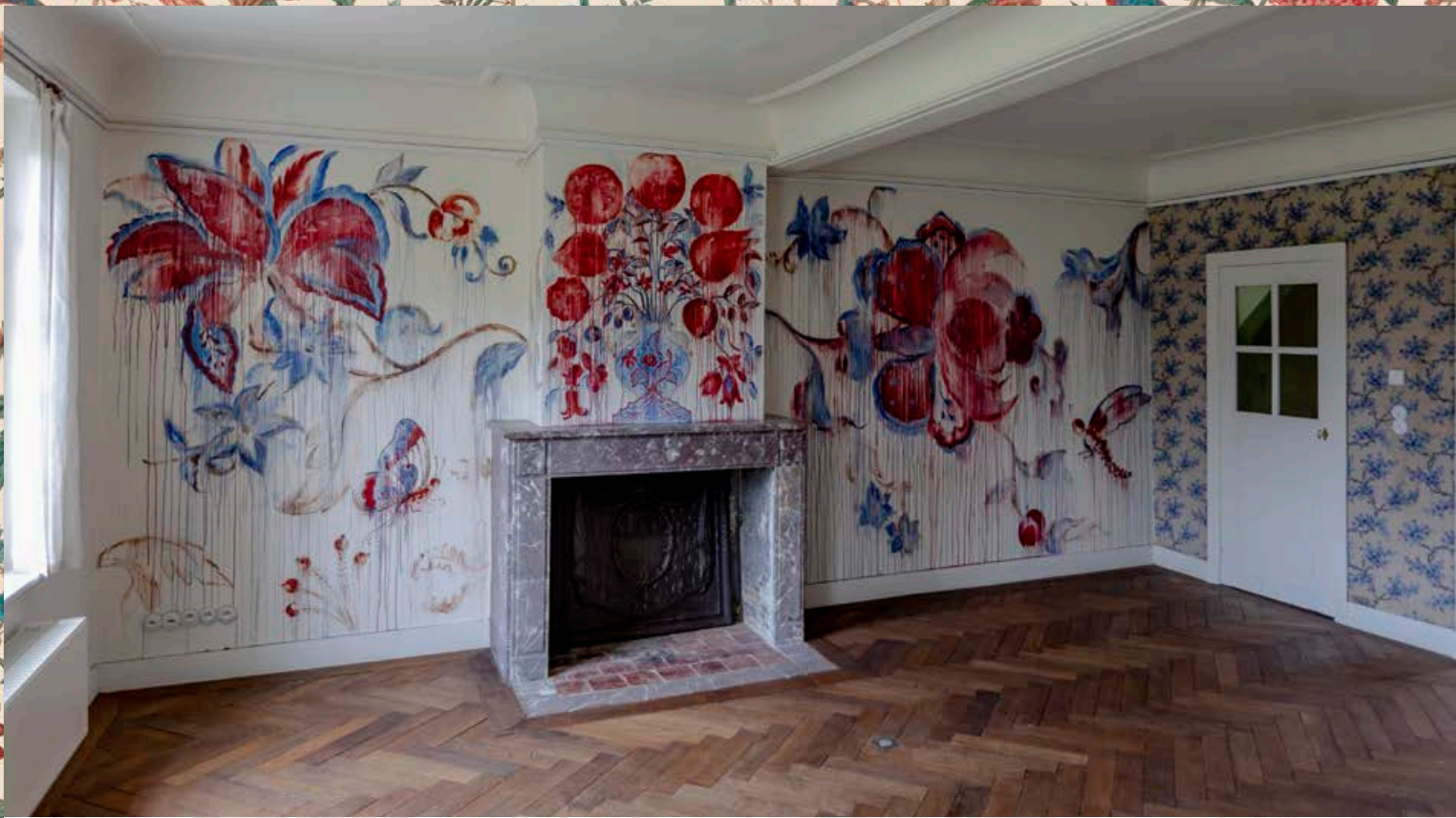
Frayed Memories van Pablo Piatti (2022) · © Joris Ceuppens

De tule houdt de verschillende lagen stof mooi tegen elkaar en zorgt dat ze minder gaan doorhangen.’