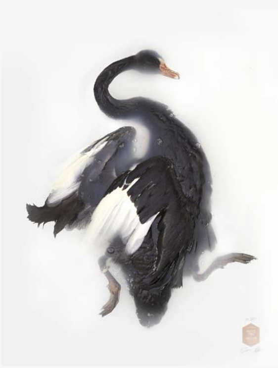
Studio Darwin, Sinke & van Tongeren