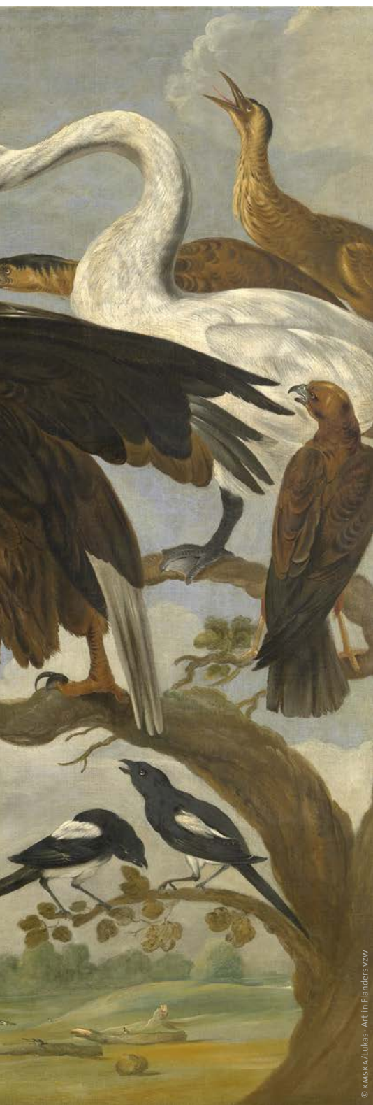
Paul de Vos

De kunstgeschiedenis begint met dieren: meer dan 30.000 jaar geleden werden ze al door mensen vastgelegd in muurschilderingen. In de eeuwen daarna hebben dierlijke afbeeldingen vooral een symbolische functie. In de middeleeuwen figureren dieren op allerlei schilderijen, maar vanaf de 17de eeuw worden ze heuse hoofdrolspelers.