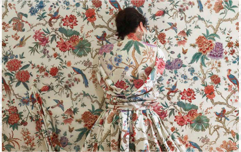
Cecilia Paredes ging aan de slag met het 19de-eeuws motief met vogels en bloemen

We combineren dit bijzondere verhaal met tientallen bruiklenen van het Antwerpse ModeMuseum, nooit eerder getoonde interieur-zichten en werken van hedendaagse kunstenaars.