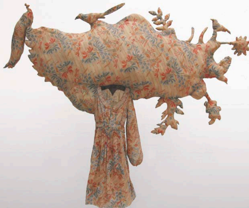
Links: een laat 18de-eeuwse kamerjas die door heren van stand op informele momenten werd gedragen · © Jacoba de Jonge Rechts: Emilie Faïf, Excroissance (2006) · © Emilie Faïf

waarden uit andere disciplines. Soms is de inspiratie erg letterlijk, soms zijn de verwijzingen eerder subtiel. De hedendaagse kunst biedt een verrassende kijk op de technieken, patronen en kleuren uit het historische luik van deze tentoonstelling.