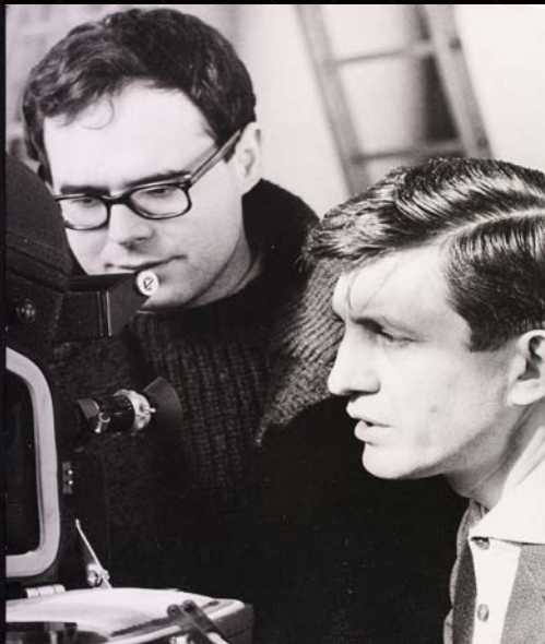
Regisseur Harry Kümel en cameraman Herman Wuyts