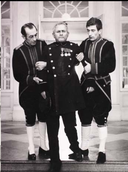
Julien Schoenaerts als grafbewaker