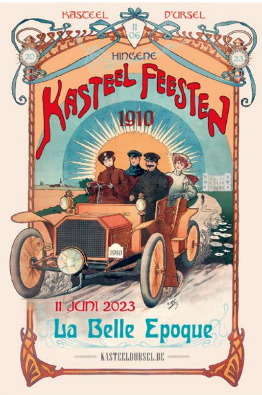
Ontwerp gebaseerd op de affiche van het Salon de l'Automobile 1905 vormgeving: Leen Depooter – quod voor de vorm