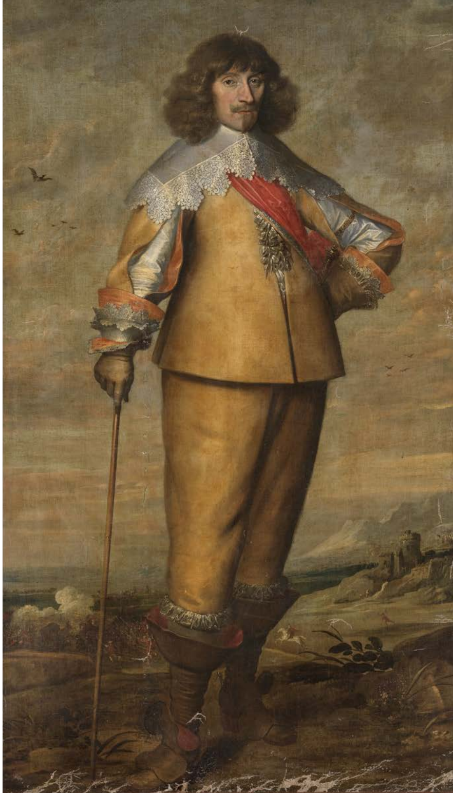
Vermoedelijk portret van Lancelot Schetz, 2de graaf van Grobbendonk (1606–1664) · olieverf op doek · ca. 1635 (privéverzameling)

'Helaas werd het kasteel op 12 februari slachtoffer van een inbraak, gaat het verder. 'De zes portretten werden uit hun kaders gesneden en meegenomen. Het gaat om de portretten van de hertogin d'Ursel (geboren Eléonore de Salm), de hertogin