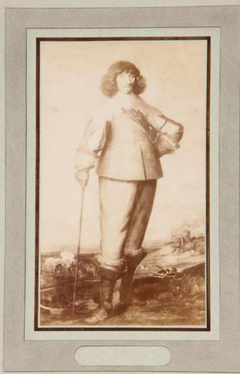
Reproductie van het portret in Tableaux d'Hingene (1886) (privéverzameling)