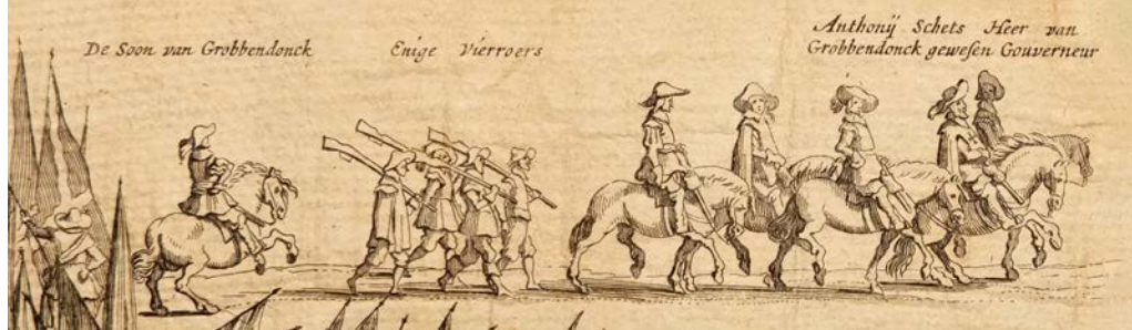
Claes Jansz. Visscher, Grote kaart van het beleg van Den Bosch door Frederik Hendrik [detail] ets en gravure - 1629