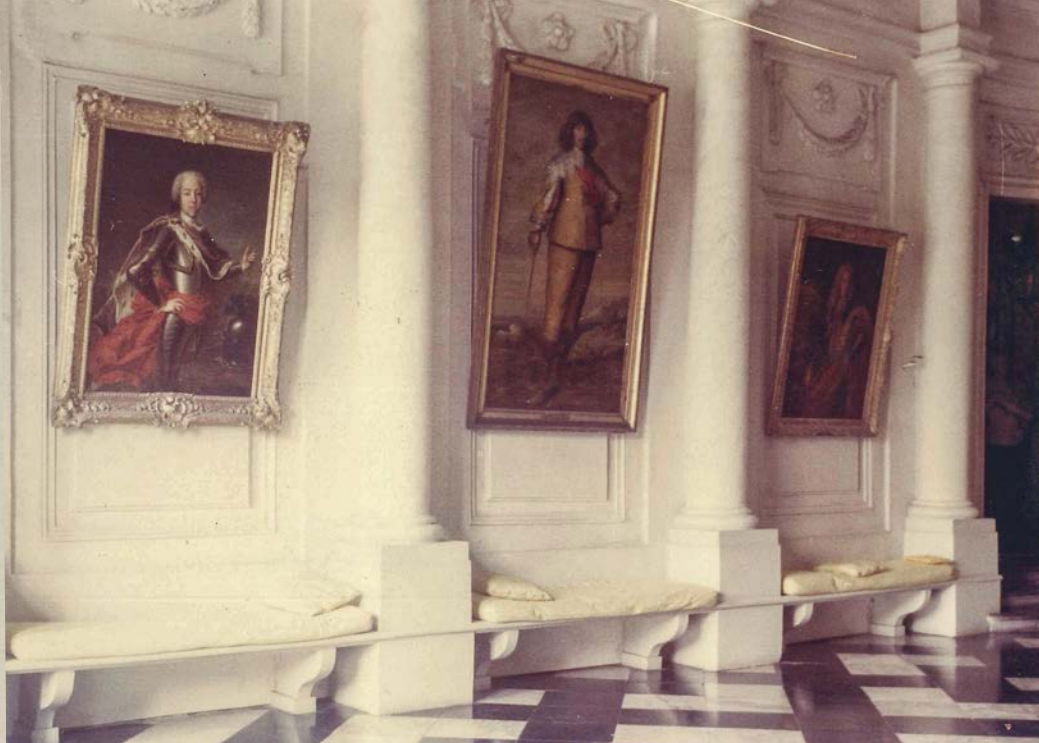
De vestibule van het kasteel, ca. 1970

Laat me zeggen dat deze portretten me tot hun diefstal dierbaar waren. Het opgeven van de muren van het hôtel d'Ursel, van de muren en de tuinen van Hingene (...) verontrustte me relatief weinig, maar wat moest er gebeuren met al deze schilderijen (ik dacht aan hen alsof het levende mensen waren), bij gebrek aan ruimte in moderne huizen, bij gebrek aan een nationale portretgalerij, zoals die van Londen? Ik dacht waarschijnlijk minder aan hen dan aan mijn verantwoordelijkheid tegenover hen, want zodra ze gestolen waren, voelde ik me bevrijd.