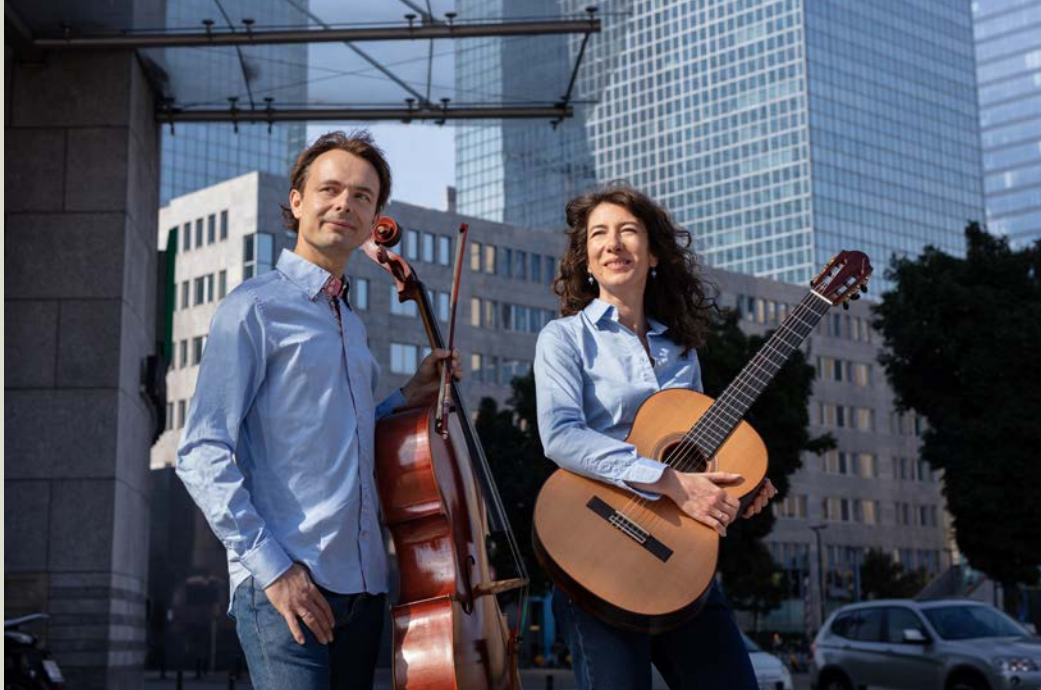
Edenwood Duo © Isabelle Pateer

Info en reservatie CC Ter Dilft | 03 890 69 30 | www.terdilft.be