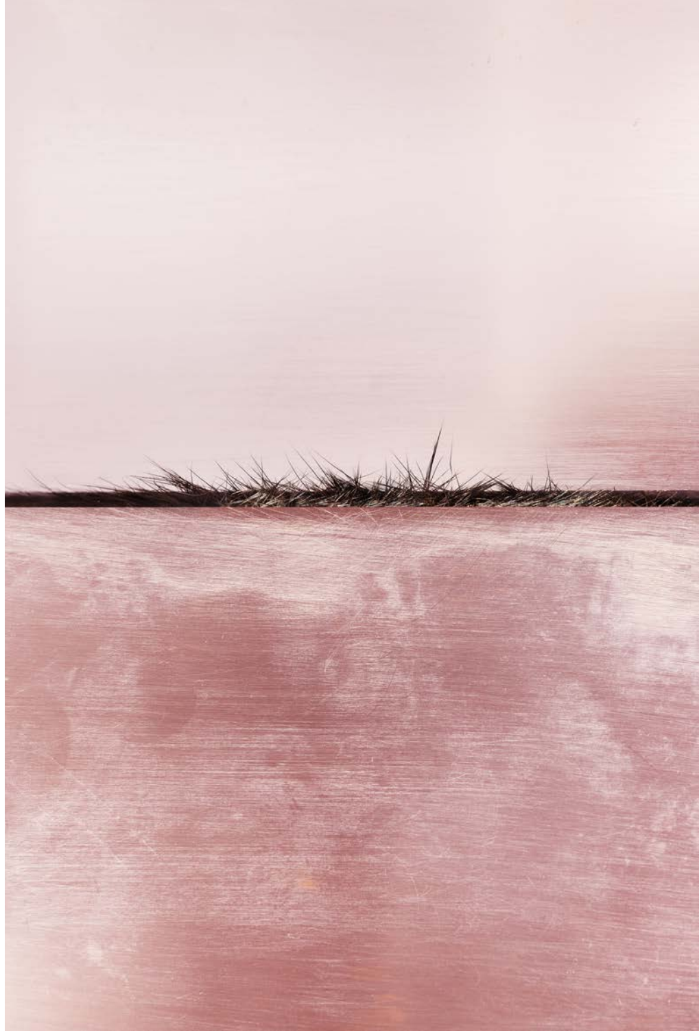
Daphne van de Velde, The Seducer (2021) · Courtesy Black Swan Gallery & Daphne van de Velde

Verspreid over de drie verdiepingen van het kasteel ontdek je vervolgens enkele 18de- en 19de-eeuwse erotische objecten, tekeningen en schilderijen uit Belgische verzamelingen. Weinig mensen denken bij het victoriaanse tijdperk meteen aan sekspeeltjes. Toch bleven er heel wat voorbeelden van bewaard. Uit de collectie van de Phoebus Foundation komen twee ivoren fallussen die eufemistisch 'damesgezel' werden genoemd. In een verborgen schuifje zit een ketting met anale kralen. Twee erotische paneeltjes op ivoor tonen scènes waarin zowel mens als dier hun lusten botvieren. Twee snuifdozen van de Koning Boudewijnstichting zijn rijkelijk versierd met een galante en een vrijpostige scène.