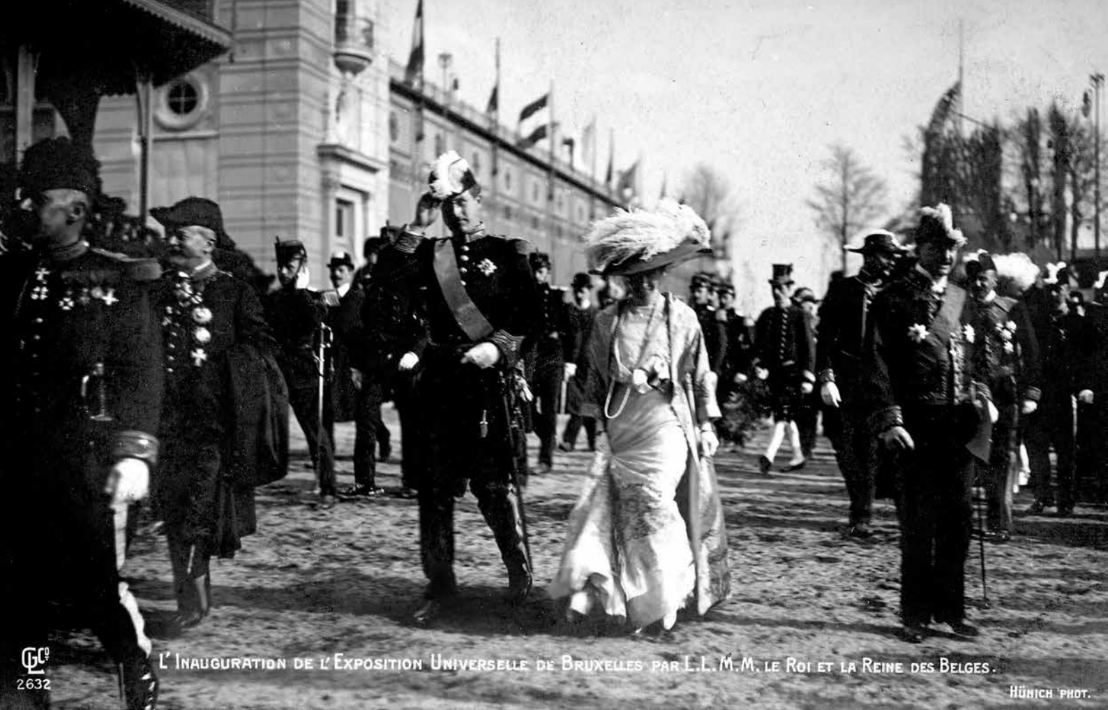
L'INAUGURATION DE L'EXPOSITION UNIVERSELLE DE BRUXELLES PAR L.L.M. LE ROI ET LA REINE DES BELGES.