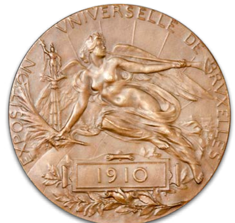
Een herdenkingsmedaille, ontworpen door de Brusselse beeldhouwer, graveur en medailleur Charles Samuel, toont de jonge hertog in profiel, het wapenschild van de familie, de naam van de maker en de tekst 'MGR LE DUC D'URSEL COMMISSAIRE GENERAL DU GOUVERNEMENT'. Op de keerzijde staat een allegorische voorstelling, het jaartal 1910 en het opschrift 'EXPOSITION UNIVERSELLE DE BRUXELLES'.