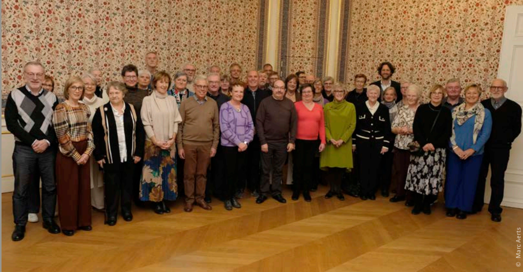
Ons vrijwilligersfeest op 24 november 2022

De aanplant gebeurde met steun van de lezers van dit Magazine. Dankzij onze projectrekening bij de Koning Boudewijnstichting is een gift aan het kasteel fiscaal aftrekbaar. Elke gift vanaf 40 euro (art. 145/33 WIB) geeft zo recht op een belastingvoordeel van 45%. Zowel particuliere giften als bedrijfsgiften zijn fiscaal aftrekbaar. Wil jij het kasteel ook steunen? Stort dan jouw vrije bijdrage op onze projectrekening IBAN BE10 0000 0000 0404 (BIC: BPOFBEB1) van de Koning Boudewijnstichting, met als gestructureerde mededeling +++128/3297/00095+++.