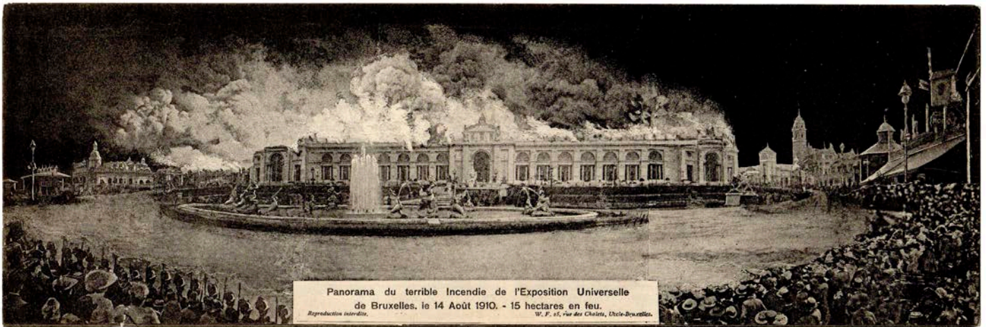
Panorama van de verschrikkelijke brand van de Wereldtentoonstelling in Brussel

paviljoenen van Duitsland ('een gedrongen en grijze architectuur, krachtig maar melancholisch en bijna helemaal klaar'), Nederland ('roze en witte bakstenen met pittoreske gevels en een hoge toren'), Spanje ('met een integrale reproductie van het Leeuwenhof uit het Alhambra') en 'het charmante paviljoen van de stad Brussel, in Vlaamse renaissancestijl. [...] Onder een stralende zon werd de koning toegejuicht en bedankt omdat hij er op democratische wijze op had aangedrongen dat, behalve de gasten, het publiek werd toegelaten bij de inhuldiging van de tentoonstelling.'