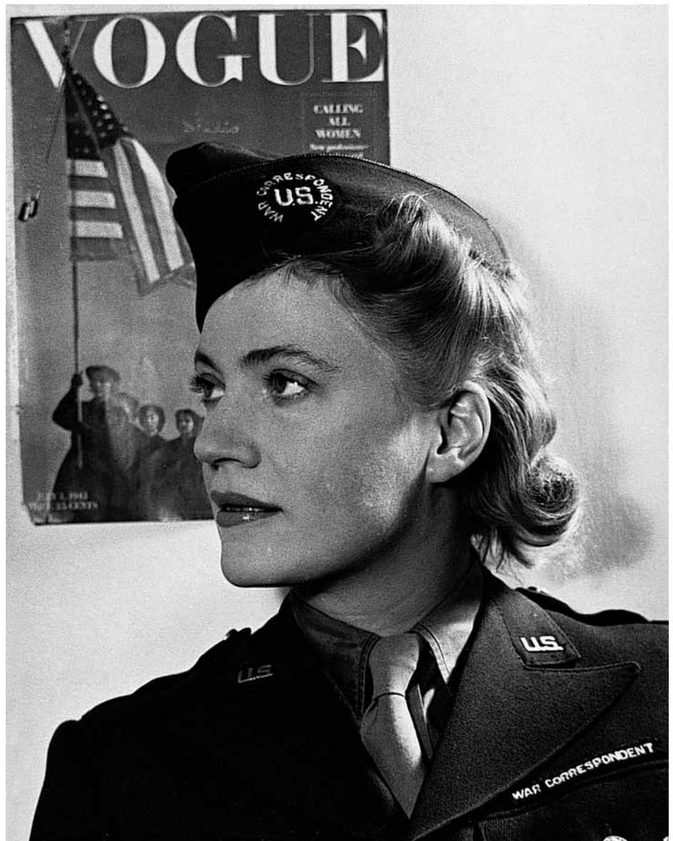
Lee Miller · Londen 1943 ·