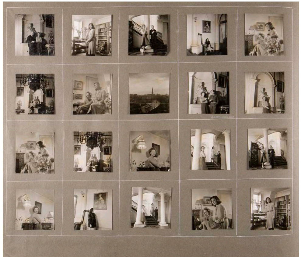
Pagina uit het familiealbum •

Wanneer ik met hen contact opneem, in de hoop nog wat meer over de ontmoeting met de d'Ursels te ontdekken, krijg ik een overzicht van de foto's die Lee Miller in Brussel nam. Op enkele varianten van de foto's uit het familiealbum na, zitten daar geen nieuwe foto's van de familie d'Ursel bij. Dit doet me besluiten dat de ontmoeting met Lee Miller niet langer dan een voormiddag duurde. Ik krijg ook een kopie van de brief die Lee Miller naar haar uitgeefster stuurde. Bovenop wat letterlijk in Vogue verscheen, valt er nog één opmer-