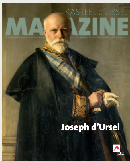
Portret schilderij Joseph d'Ursel door Emile Wauters

Als ik hier als afscheidnemend gedeputeerde terugblik op het bijzondere verhaal achter dit kasteel, dan kan ik wel stellen dat het begin van het provinciale d'Ursel-verhaal een bijzonder begin was. In de eerste jaren na de aankoop opperde menig scepticus immers dat dit Kasteel d'Ursel alleen maar overtollige ballast betekende voor het provinciebestuur. Gelukkig waren er ook heel wat mensen die wél een mooie toekomst zagen voor dit domein. En zo werd een lang proces werd doorlopen om dit kasteel vaste en stevige fundamenten te geven.