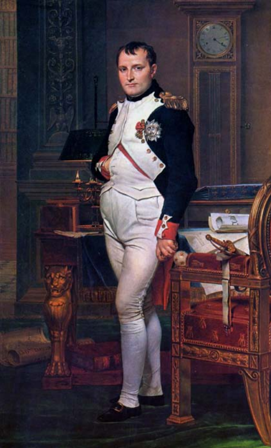
Portret van Napoleon (1812) door Jacques-Louis David

– die de adellijke fortuinen geen deugd had gedaan – zei de keizer: ‘Dat was het werk van de revolutionairen. Ze wilden niets meer met de adel te maken hebben en hebben haar ten gronde gericht. Als het te herdoen was, ik zou het niet gedaan hebben.’