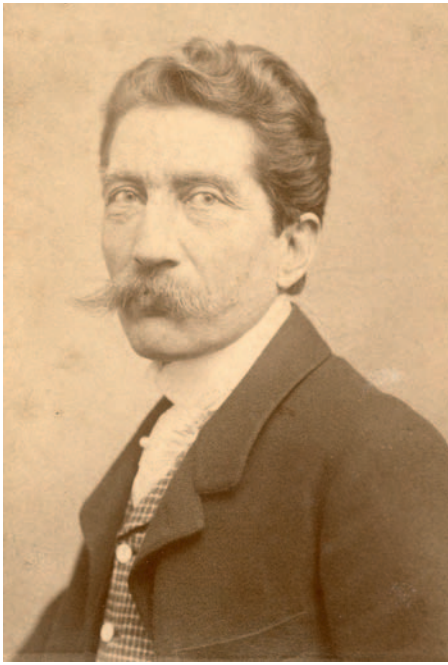
Fotografisch portret Emile Wauters