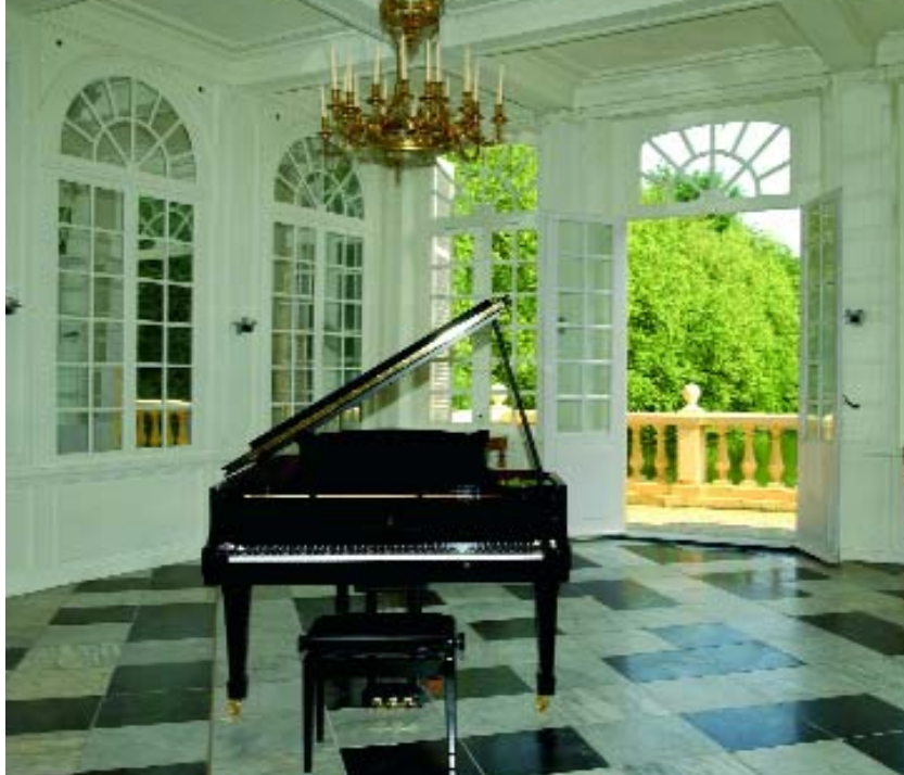
De Steinway-vleugelpiano in de Spiegelzaal.

Bovendien verlopen masterclasses dikwijls in een heel ontspannen sfeer, zonder de druk van wedstrijden. We konden gewoon muziek spelen en er samen van genieten. Tijdens het slotconcert zagen we direct de resultaten van wat we tijdens de lessen hadden geleerd. Soms was het heel fijn om te zien hoeveel je speelstijl kan verbeteren op een paar dagen tijd... Ik vond het ook leuk om studenten van over de hele wereld te leren kennen, allemaal met hun eigen achtergronden en ervaringen, om van gedachten te wisselen over muziek en - eerlijk gezegd - ook over een heleboel andere dingen! (lacht)"