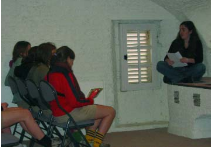
De vertellers in actie. Op zondag 1 en zaterdag 21 mei kan je ze opnieuw aan het werk horen.