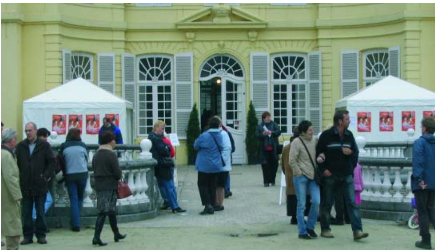
Meer dan 1 500 mensen brachten een bezoek aan het kasteel.